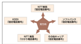
双方向番号ポータビリティ